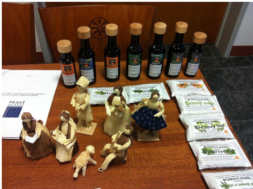
Betlém od Evy Eliášové z Hovězí